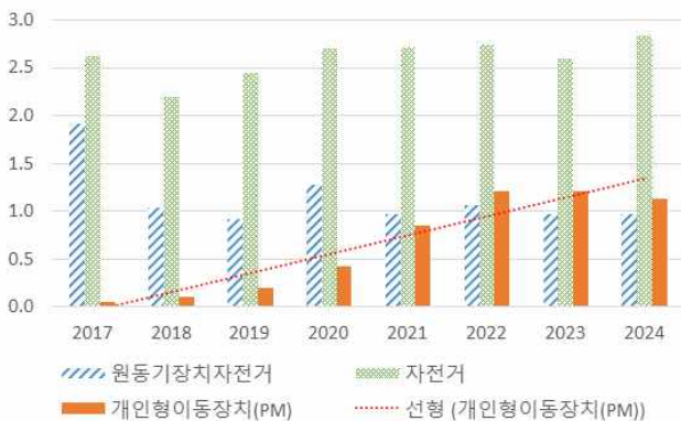
〈그림 2〉 2024년 차종별·법규위반별 사고 비중