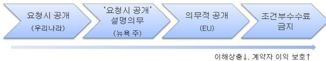
〈그림 2〉 보험중개사의 수수료·보수와 그 밖의 대가에 대한 규제