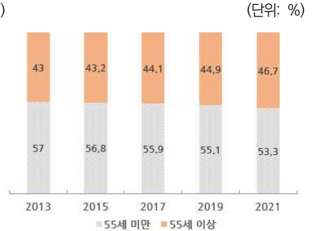
〈그림 2〉 미국 의사의 연령별 비중 추이