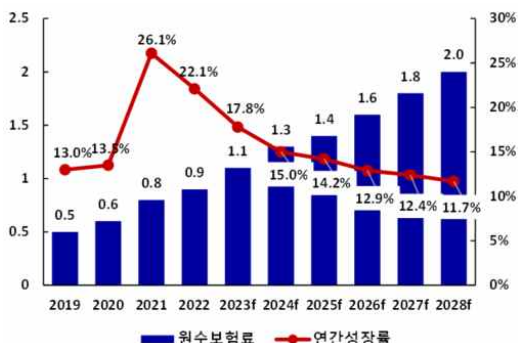
〈그림 1〉 인도 건강보험 원수보험료 및 성장률 전망 (단위: 조 루피)