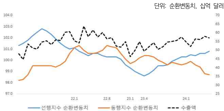
〈그림 1〉 주요 경기 관련 지수 추이