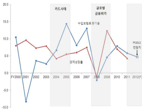
〈그림 3〉 생명보험 수입보험료 증가율과 경제성장률