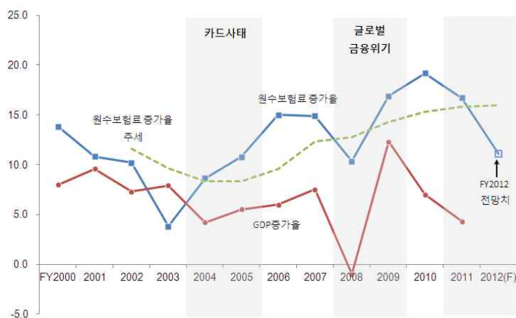
〈그림 5〉 손해보험 원수보험료 증가율과 경제성장률

■ 경제성장률 하락이 지속될 경우 국내 보험산업은 부정적인 영향을 받을 수밖에 없으며, 이에 대한 대비를 철저히 할 필요가 있음.