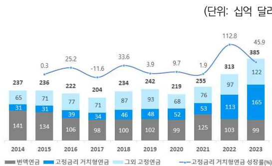
〈그림 1〉 개인연금 판매액 및 고정금리 거치형연금 성장률 추이