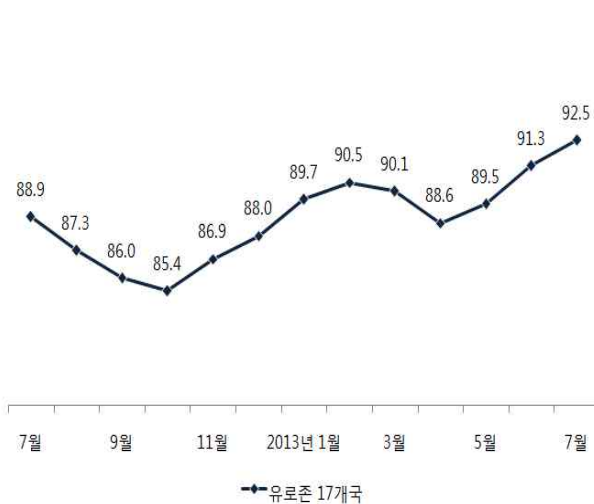
〈그림 1〉 유로존(17개국) 경기체감지수