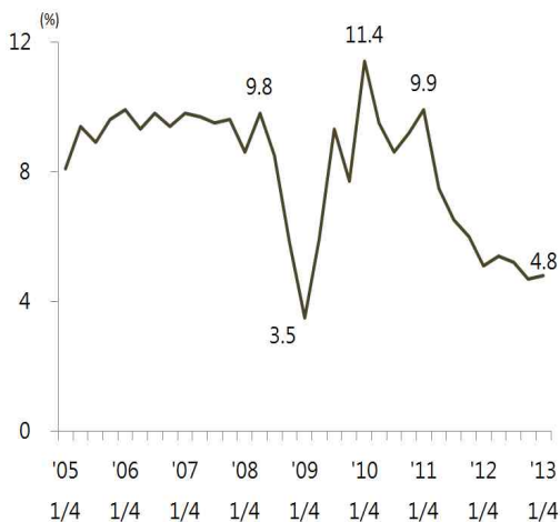
〈그림 1〉 인도 분기별 경제성장률