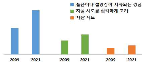
<그림 2> 미국 고등학생 정신건강 상태 및 자살 행동 변화