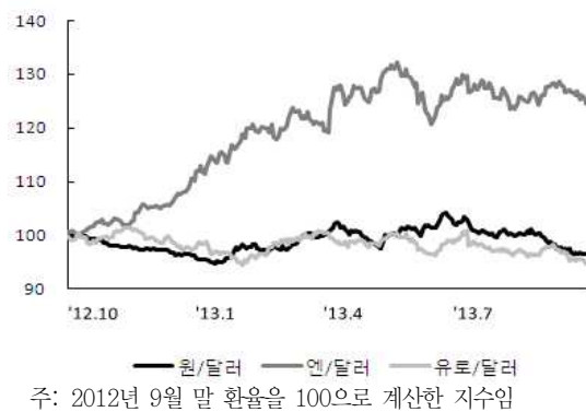
〈그림 2〉 주요국 통화의 대미달러 환율 추이

주: 2012년 9월 말 환율을 100으로 계산한 지수임 자료: 한국은행