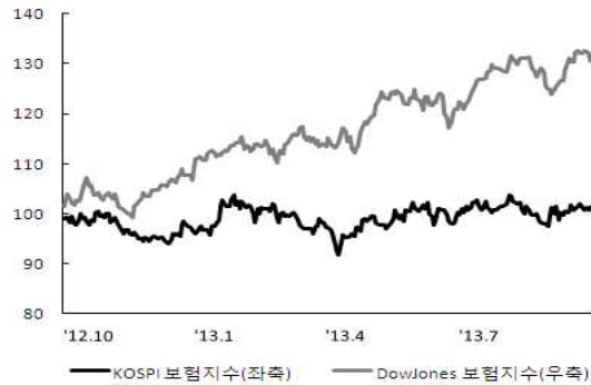
〈그림 4〉 한국, 미국 보험지수 추이

주: 2012년 9월 말 주가지수를 100으로 계산한 지수임 자료: 한국거래소, Bloomberg