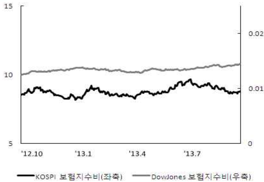
〈그림 5〉 한국, 미국 보험지수비 추이

주: 보험지수비=보험지수/전체지수로 계산함 자료: 한국거래소, Bloomberg