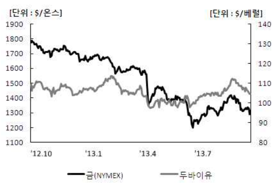
〈그림 6〉 국제유가, 금 가격 추이

주: 보험지수비=보험지수/전체지수로 계산함