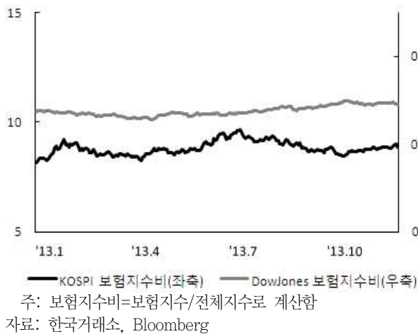
〈그림 5〉 한국, 미국 보험지수비 추이