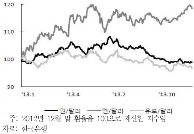
〈그림 2〉 주요국 통화의 대미달러 환율 추이