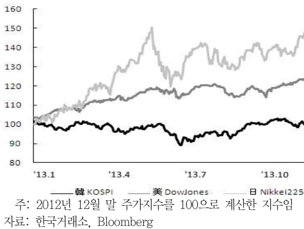
〈그림 3〉 주요국 주가지수 추이