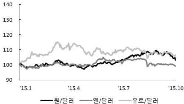
〈그림 2〉 주요국 통화의 대미달러 환율 추이

주: 2014년 12월 말 환율을 100으로 계산한 지수임