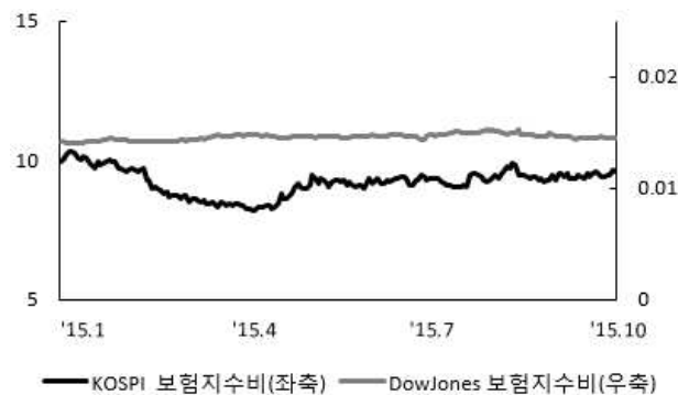
〈그림 5〉 한국, 미국 보험지수비 추이

주: 보험지수비=보험지수/전체지수로 계산함 자료: 한국거래소, Bloomberg