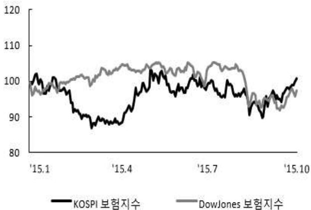
〈그림 4〉 한국, 미국 보험지수 추이

주: 2014년 12월 말 주가지수를 100으로 계산한 지수임 자료: 한국거래소, Bloomberg