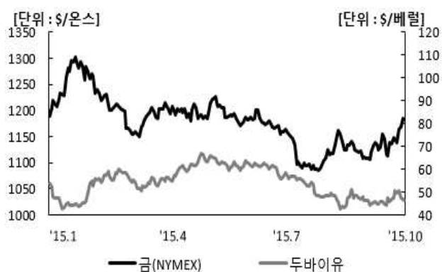
〈그림 6〉 국제유가, 금 가격 추이

주: 보험지수비=보험지수/전체지수로 계산함