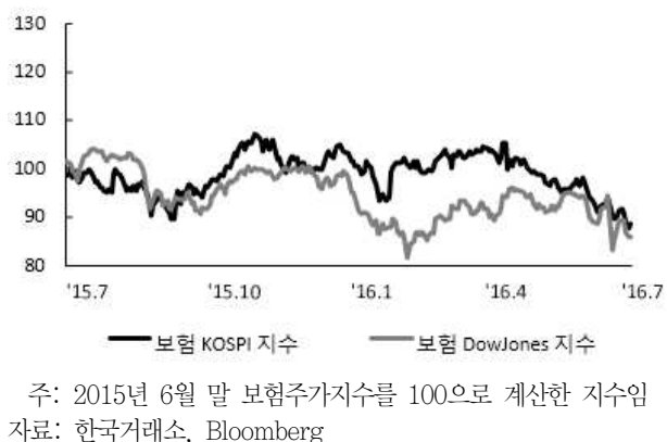
〈그림 4〉 한국, 미국 보험주가지수 추이