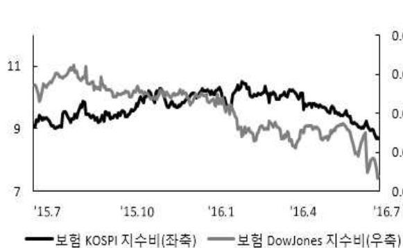
〈그림 5〉 한국, 미국 보험주가지수비 추이