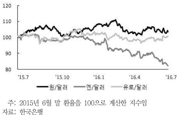
〈그림 2〉 주요국 통화의 대미달러 환율 추이