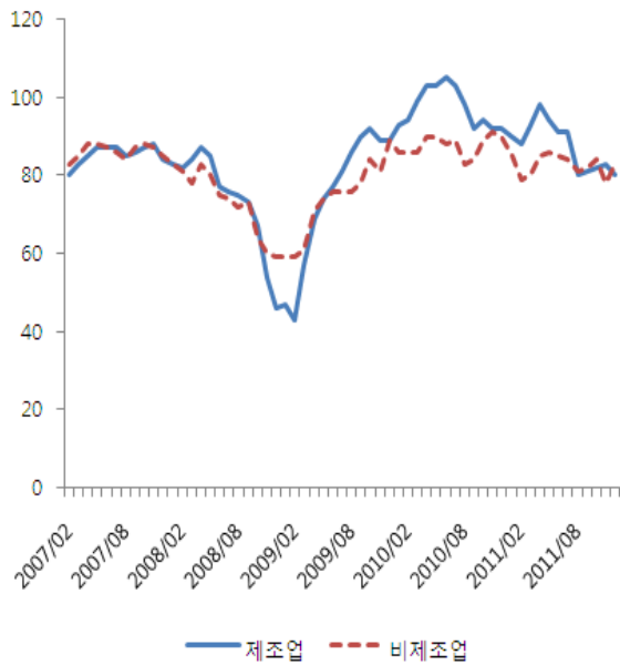
〈그림 1〉 업황 실적 BSI 추이