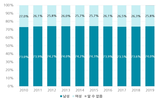
〈그림 2〉 미국 내 사망사고 운전자의 성별