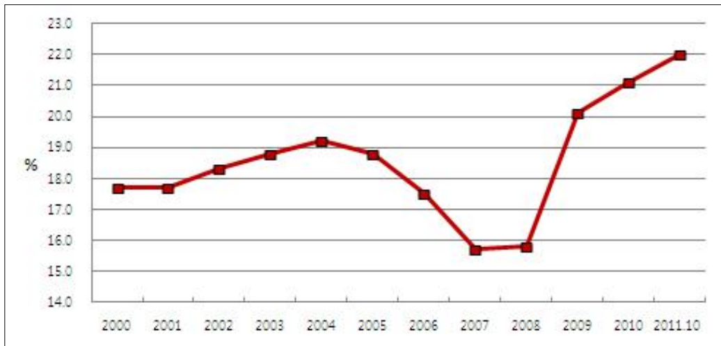
〈그림 1〉 EU 청년실업률 추이(2000~2011.10)