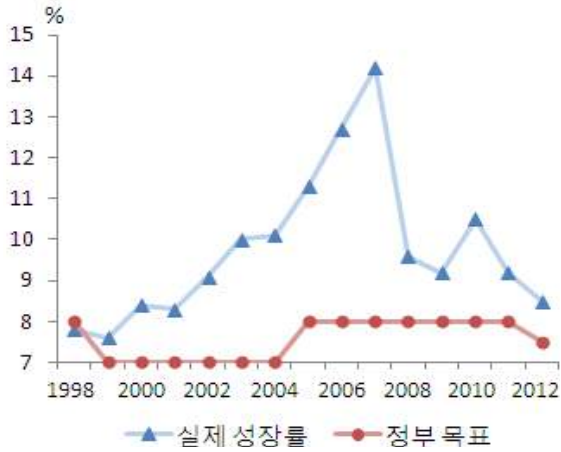
〈그림 1〉 중국정부의 목표 경제성장률과 실제 성장률 추이