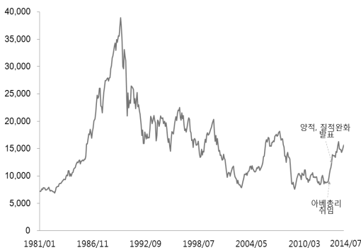
그림 I-1 일본 주식 시장(닛케이 지수)과 부동산 시장(부동산 지수)