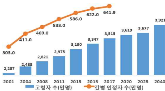
<그림 1> 일본 고령자수와 간병 인정자 수 추이